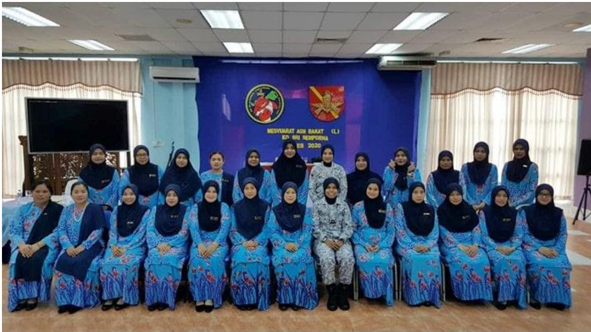
Barisan ahli jawatankuasa BAKAT (L) KD SRI SEMPORNA 2020

SEMPORNA , 18 Feb – Saban tahun BAKAT KD SRI SEMPORNA akan mengadakan Mesyuarat Agung Tahunan Bakat (L) untuk mengupas isu – isu BAKAT (L) KD SRI SEMPORNA. Kehadiran ahli BAKAT (L) KD SRI SEMPORNA pada tahun ini seramai 62 orang termasuk Pengerusi, Timbalan Pengerusi, Setiausaha dan ahli – ahli BAKAT (L) KD SRI SEMPORNA.