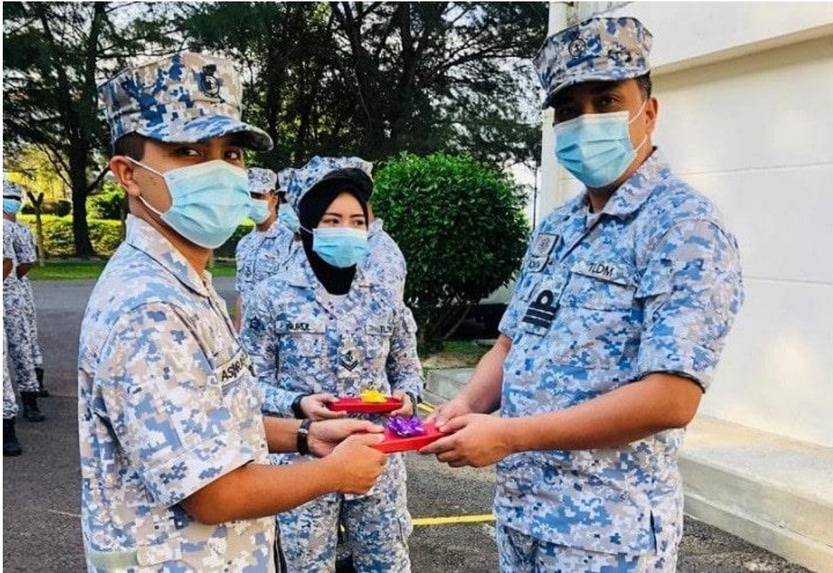
Pegawai Memerintah DSAT Menyampaikan Cenderahati

KOTA KINABALU , 11 Ogos – Dalam situasi penuh berjaga-jaga dalam Pandemik COVID-19, Depot Senggara Armada Timur (DSAT) tidak ketinggalan melaksanakan tanggungjawab kebajikan kepada warganya yang akan bertukar keluar untuk bertugas ke unit dan kapal lain. Justeru, suatu majlis ringkas dengan mematuhi Standard Operating Procedure (SOP) KKM telah dilaksanakan di dataran DSAT dalam usaha menghargai sumbangan mereka sepanjang berkhidmat di DSAT.