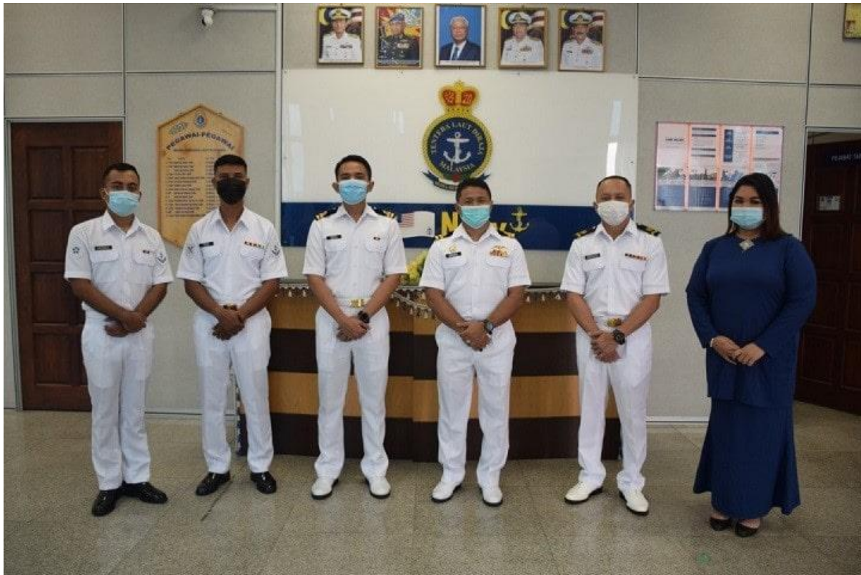
PWTL Kuching bersama anggota-anggota yang dinaikkan pangkat

KUCHING , 16 Nov – Majlis pemakaian pangkat anggota LLP PWTL dan PSTL Kuching telah berlangsung di ruang legar Pejabat PWTL Kuching dengan jayanya. Seramai 1 x anggota telah dinaikkan pangkat Bintara Kanan ke Pemangku Pegawai Waren II dan 2 x anggota LK I dinaikkan ke pangkat Pemangku Laskar Kanan. Majlis telah disempurnakan oleh Yang Berbahagia Lt Mohd Ismail Bin Yakub TLDM selaku Pegawai Wakil Tentera Laut Kuching.