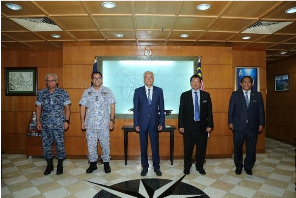
Panglima Tentera Laut dan Menteri Pertahanan bersama delegasi

KUALA LUMPUR , 30 Mac - Dato' Sri Ismail Sabri bin Yaakob hari ini melawat Markas Tentera Laut buat pertama kali sejak memegang jawatan sebagai Menteri Pertahanan.