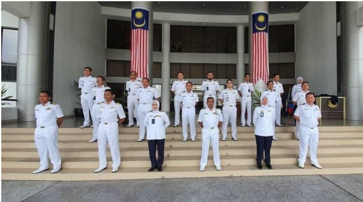
Peserta Bengkel Penetapan Kursus TLDM (HRMIS) Siri 1/20