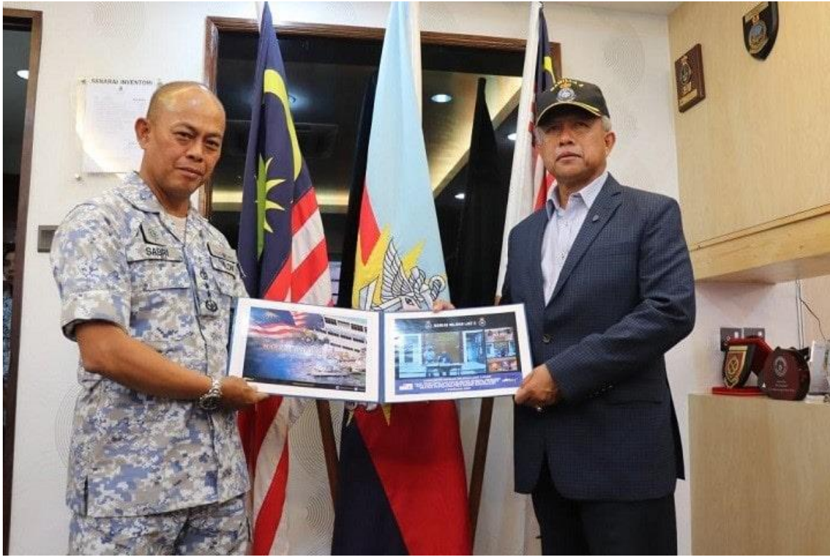
Panglima MAWILLA 2 menyampaikan cenderamata kepada Menteri Pertahanan Kedua Brunei

SANDAKAN , 4 Feb – Markas Wilayah Laut 2 (MAWILLA 2) telah diberi penghormatan untuk menerima kunjungan daripada Menteri Pertahan Kedua Brunei, Yang Berhormat Pehin Datu Lailaraja Mejar Jeneral (Bersara) Dato Paduka Seri Haji Awang Halbi bin Haji Mohd Yussof dan delegasi sempena lawatan kerja sehari ke Sandakan pada hari ini.