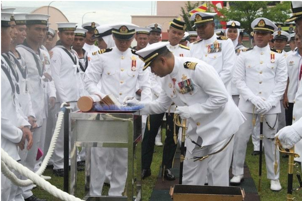
Penanaman kapsul masa oleh Pegawai Memerintah KD SRI SEMPORNA

SEMPORNA , 15 Jul – KD SRI SEMPORNA – Unit 2 PASKAL telah menjayakan Sambutan Hari Pentauliah Pasukan kali ke-15 mulai 3 hingga 15 Jul 20 telah berlangsung dengan meriah. Sepanjang berlangsungnya sambutan ini, beberapa aktiviti telah dilaksanakan dengan jayanya. Antara sambutan yang telah dijalankan adalah: