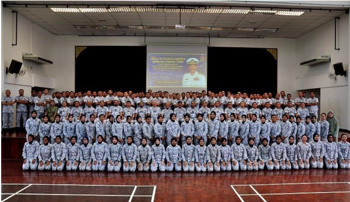
Panglima Armada Timur bersama warga Navy People MAWILLA 2