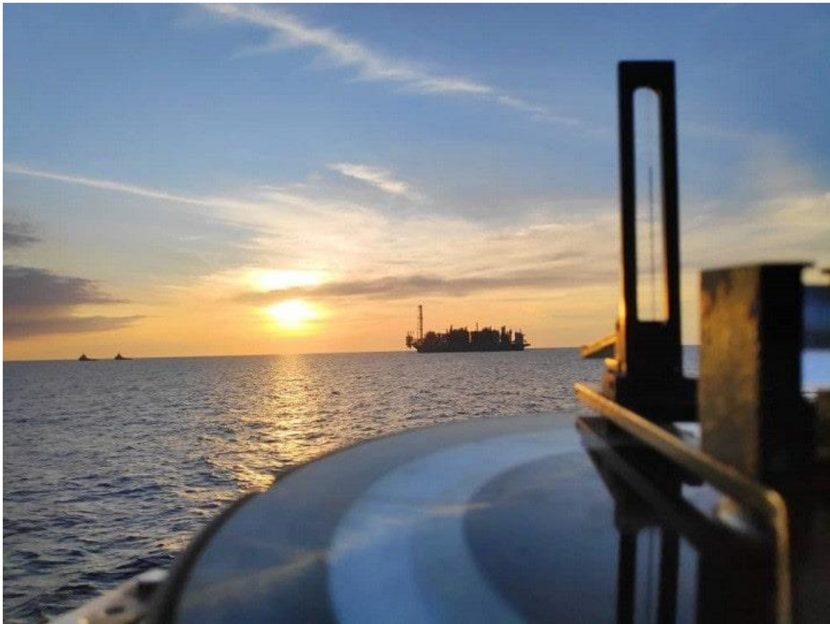
Tenang. Pemandangan PFLNG DUA dari KD LEKIU

LUMUT , 30 Jan - OP ROTAN merupakan operasi yang telah ditugaskan kepada Angkatan Tentera Malaysia (ATM) amnya dan Tentera Laut DiRaja Malaysia (TLDM) khasnya bagi mengiringi struktur mega PETRONAS Floating Liquefied Natural Gas (PFLNG) DUA milik Syarikat Petroliaam Nasional Berhad (PETRONAS). Operasi ini telah diaktifkan bermula 15 Feb hingga 3 Mac 20 dan berkonsepkan Op Iring yang melibatkan aset TLDM iaitu KD LEKIU, pesawat Super Lynx dan Pasukan Khas Laut (PASKAL) bagi mengiringi PFLNG DUA dari Samsung Heavy Industry (SHI), Geoje, Korea Selatan ke Medan Rotan yang terletak 120 batu nautika Timur Laut Labuan.