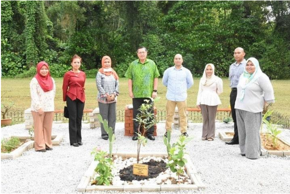
Panglima Armada Barat bergambar bersama Komuniti Blok C-32 di Landskap Taman FATAMA