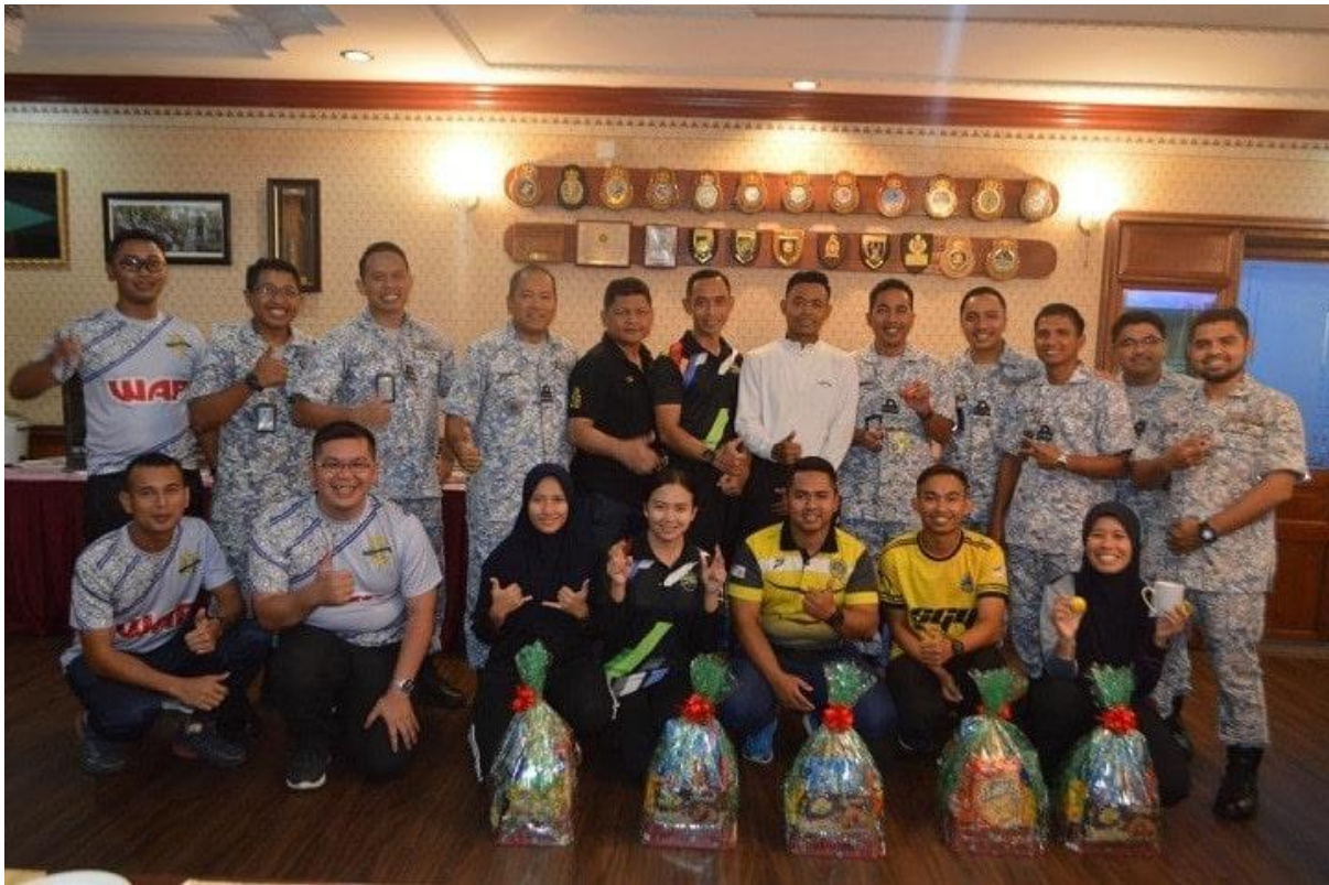
Pegawai Wisma Anchor Point yang telah memeriahkan aktiviti sukan pegawai MAWILLA 2

SANDAKAN , 5 Feb – Wisma Pegawai Markas Wilayah Laut 2 (MAWILLA 2), Wisma Anchor Point (WAP) sekali lagi telah mengambil inisiatif untuk mengadakan sukan dan aktiviti riadah antara pegawai-pegawai di MAWILLA 2 bersempena pelaksanaan aktiviti sukan pada petang hari Rabu setiap minggu.