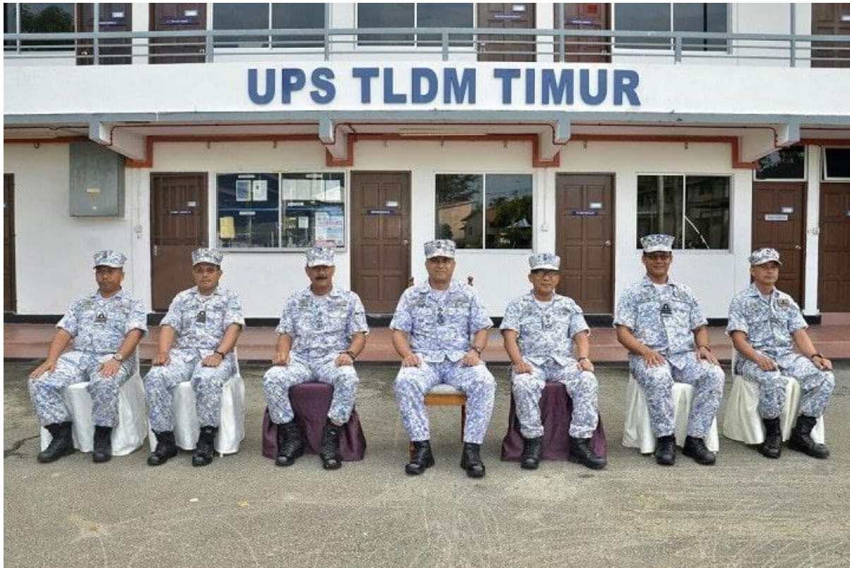
Panglima Tentera Laut bersama delegasi bergambar di hadapan bangunan UPS TLDM Timur