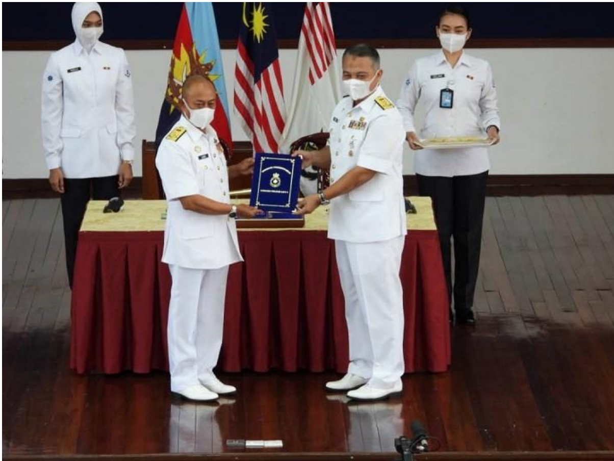
Laksdya Dato' Sabri bin Zali menyerahkan Sijil Serah Terima Tugas kepada PANGWILLA 2 yang baharu

SANDAKAN , 11 Dis – Peralihan tampuk kepimpinan Markas Wilayah Laut 2 (MAWILLA 2) telah disempurnakan secara rasmi hari ini. Detik bersejarah bagi warga MAWILLA 2 menyaksikan YBhg Laksamana Madya Dato' Sabri bin Zali secara rasminya menyerahkan jawatan Panglima Wilayah Laut 2 (PANGWILLA 2) kepada YBhg Laksamana Muda Rusli bin Ahmad. Majlis ini telah disempurnakan di Dewan Azim, RKTLDM Taman Samudera.