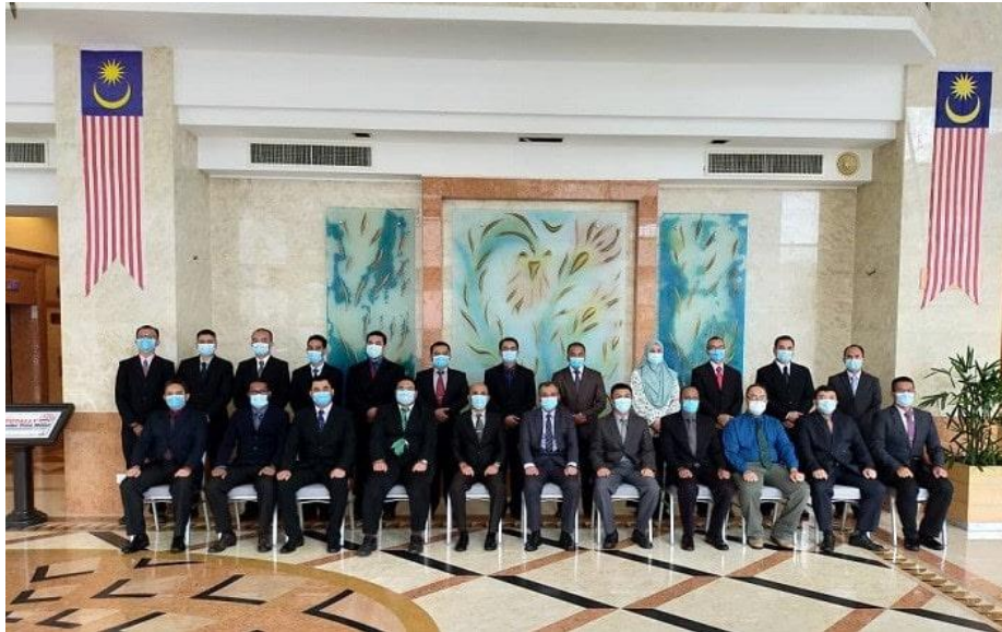
Barisan ahli Mesyuarat Kajian Pembangunan Laluan Kerjaya Cawangan Kejuruteraan

MELAKA , 14 Ogos - Mesyuarat Kajian Pembangunan Laluan Kerjaya bagi Subject Matter Experts (SME) Cawangan Kejuruteraan telah dilaksanakan pada 11 hingga 14 Ogos 2020 di Bayview Hotel, Melaka. Mesyuarat ini dipengerusikan oleh Panglima Logistik Barat merangkap Pengarah Kanan Kejuruteraan.