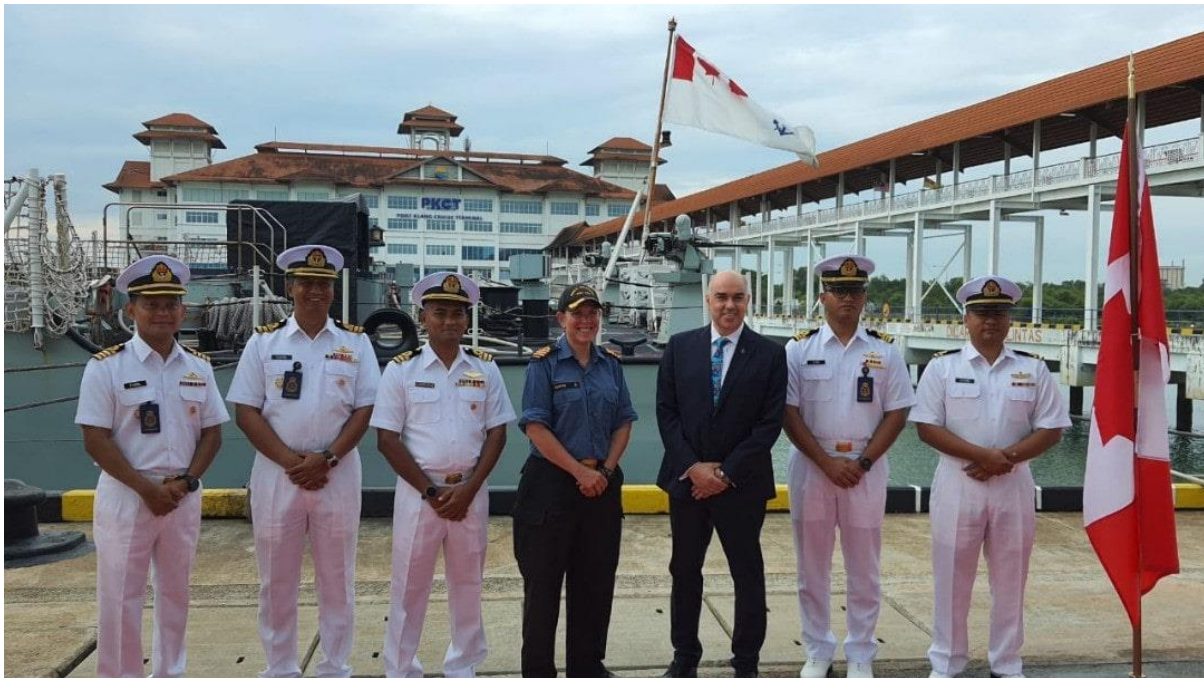
Pegawai Kanan TLDM bersama Pesuruhjaya Tinggi Kanada dan Pegawai Memerintah HMCS Winnipeg sebelum kapal belayar keluar.

PULAU INDAH , 20 Sep - Kapal frigate Tentera Laut Diraja Kanada (TLDK) HMCS Winnipeg (FFH 338) telah menamatkan lawatan operasi selama tujuh hari ini.