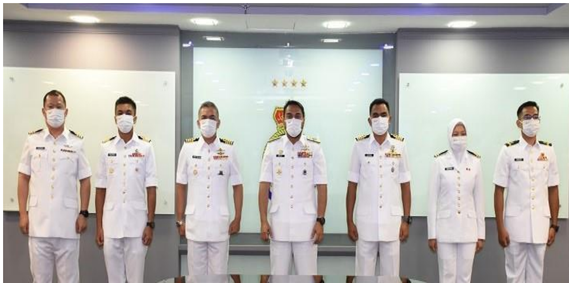
Bergambar kenangan - Panglima Tentera Laut bersama Navy People yang diraikan