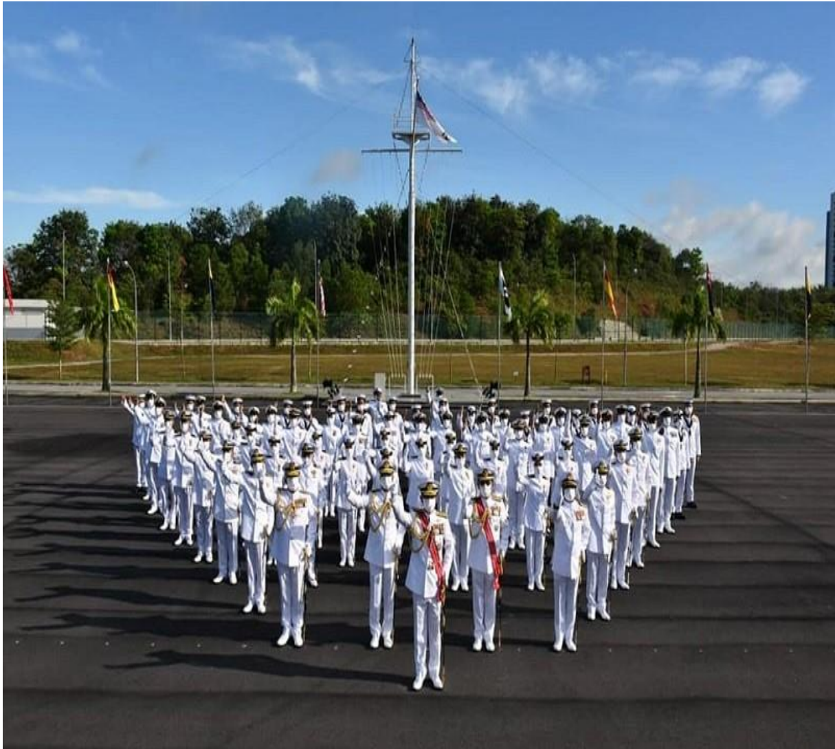
Timbalan Panglima Tentera Laut bersama warga Markas Pemerintahan Pasukan Simpanan

SUNGAI LUNCHOO , 25 Feb - Bahagian Inspektorat Jeneral Markas Tentera Laut telah melaksanakan Audit Kesiapsiagaan (AK) ke atas Markas Pemerintahan Pasukan Simpanan (MPPS) mulai 22 - 25 Feb 22.