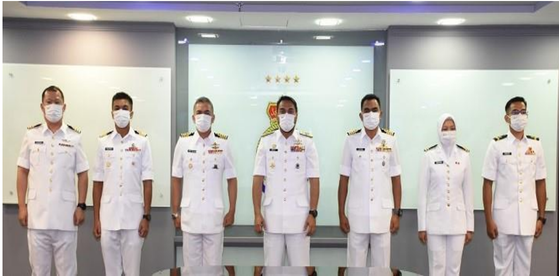
Bergambar kenangan - Panglima Tentera Laut bersama Navy People yang diraikan