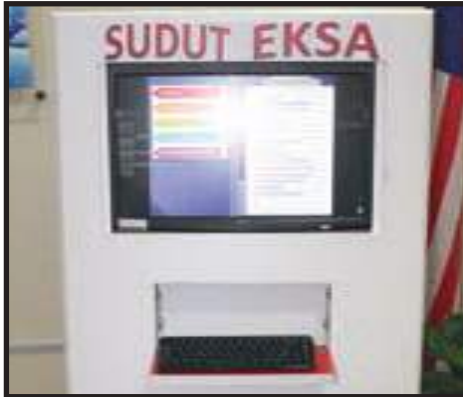
Sudut EKSA Secara Maya