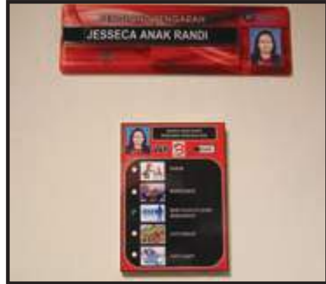
Label Setiap Unit /Bilik yang Seragam