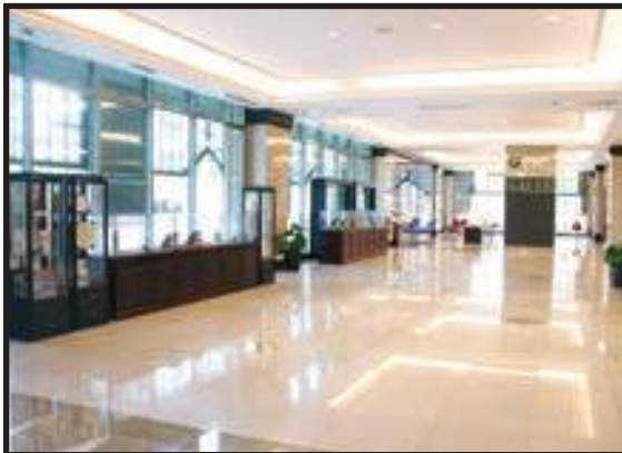
Lobi Utama Bersih dan Ceria