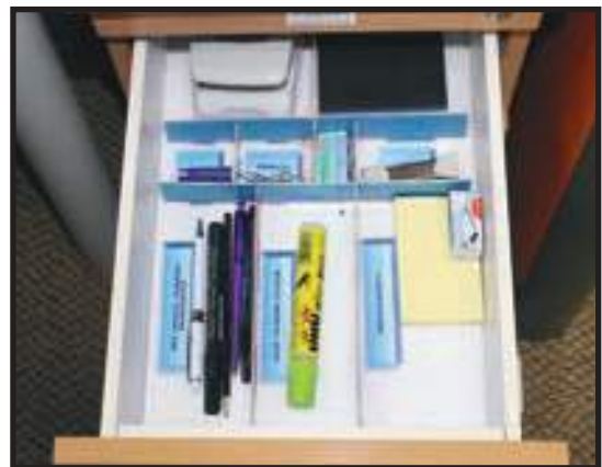
Peralatan dalam Keadaan Baik