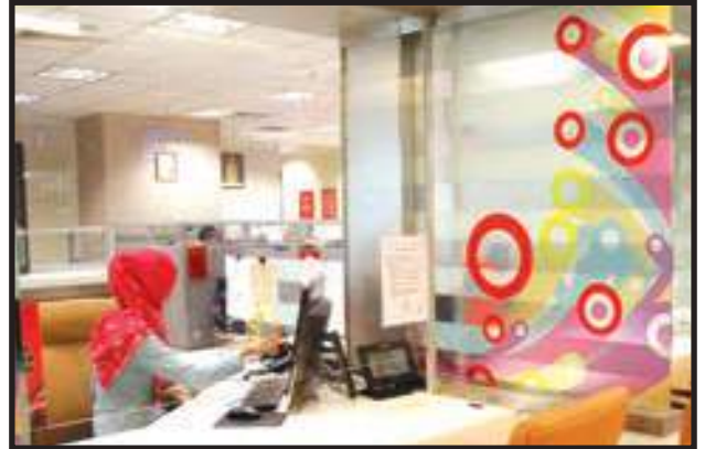
Usaha Menceriakan Pelanggan