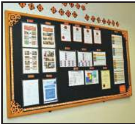
Penyediaan Sudut EKSA