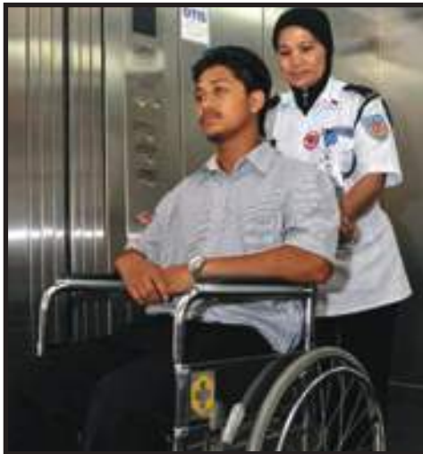
Kemudahan OKU Disediakan

Persekitaran kondusif adalah penting dalam memperkukuhkan budaya organisasi berprestasi tinggi dan inovatif dalam kalangan jabatan/agensi sektor awam. Amalan EKSA menggalakkan jabatan/agensi sektor awam memberikan penekanan pada penyampaian sistem perkhidmatan, mesra pelanggan dan memberi keselesaan semasa berurusan. Bagi pelanggan orang kurang upaya (OKU), kemudahan yang sesuai harus disediakan.