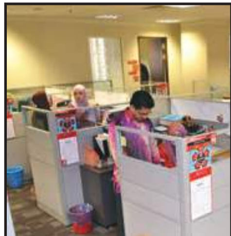
Ruang Kerja yang Kemas

Persekitaran kondusif adalah penting dalam memperkukuhkan budaya organisasi berprestasi tinggi dan inovatif dalam kalangan jabatan/agensi sektor awam. Amalan EKSA menggalakkan jabatan/agensi sektor awam memberikan penekanan pada penyampaian sistem perkhidmatan, mesra pelanggan dan memberi keselesaan semasa berurusan. Bagi pelanggan orang kurang upaya (OKU), kemudahan yang sesuai harus disediakan.