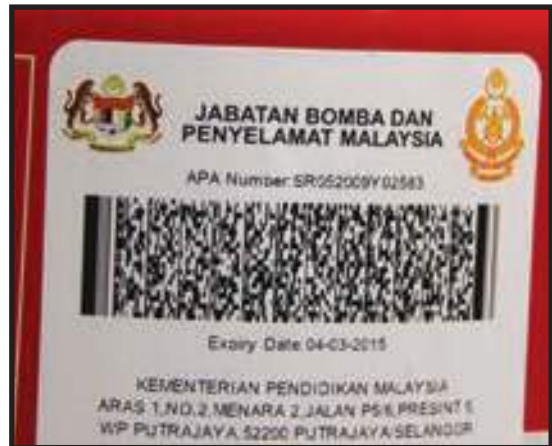
Alat Pemadam Api Diselenggara