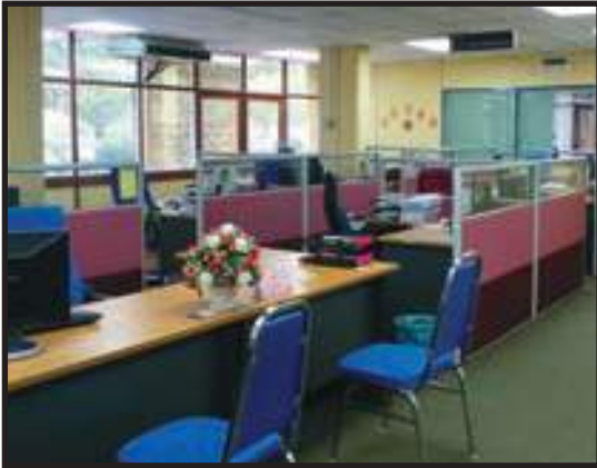
Ruang Kerja Kemas