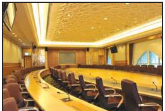
Bilik Mesyuarat Bersih