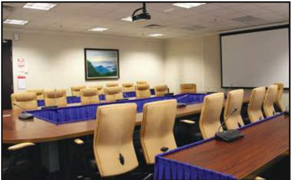
Keadaan Bersih, Selesa dan Berimej Korporat