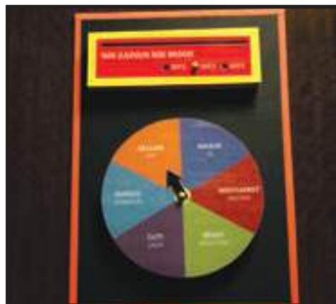
Ciri-ciri Kreativiti dan Inovasi