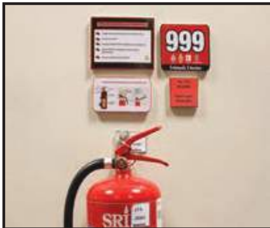
Alat Pemadam Api dan Tatacara Penggunaan