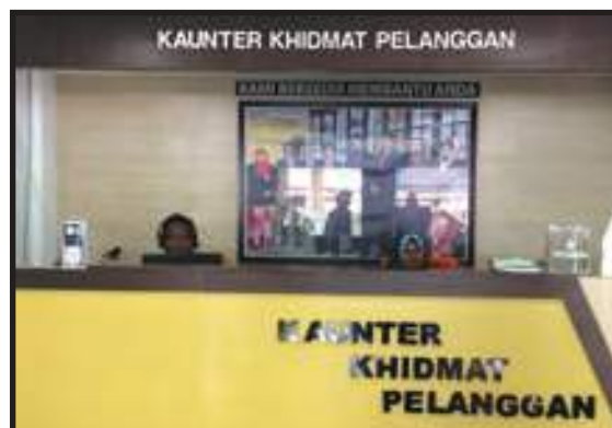
Kaunter Utama Bersih dan Kemas