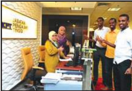
Perkhidmatan yang Mesra Pelanggan