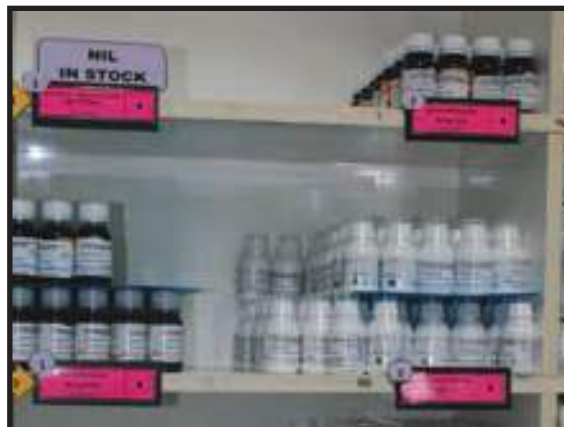
Pengurusan Stor yang Baik