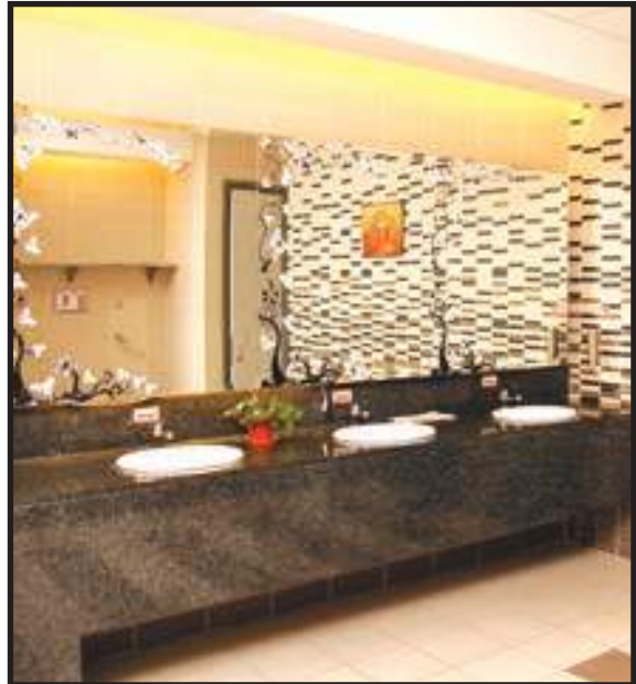
Peralatan Tambahan di Tandas