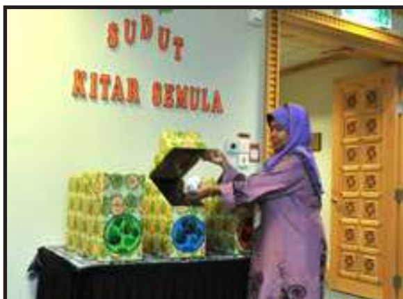
Pelaksanaan Kitar Semula