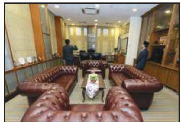
Bilik Pegawai Berimej Korporat