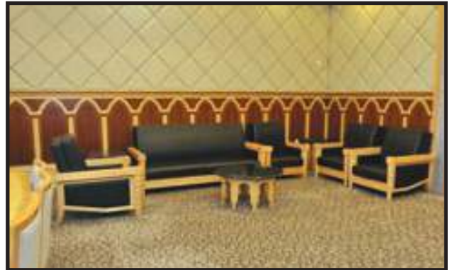
Ruang Hadapan Tetamu Berimej Korporat