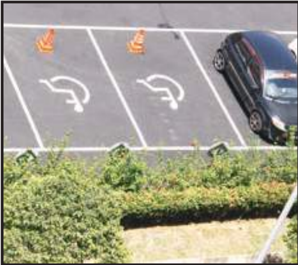
Tempat Letak Kereta OKU