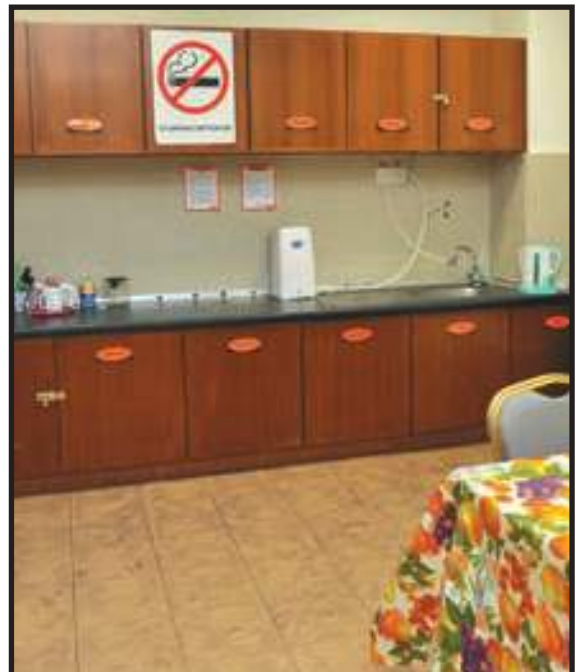
Pantri Kemas dan Teratur