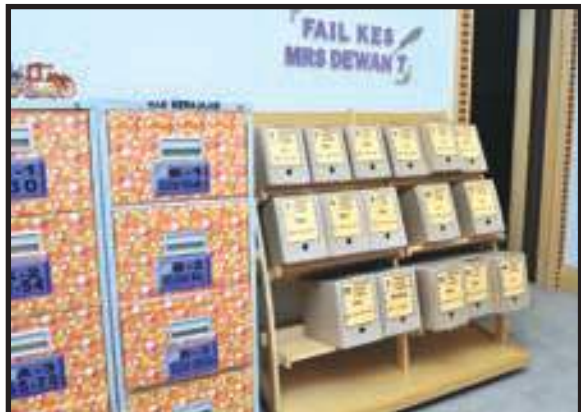
Bilik Fail Bersih dan Teratur