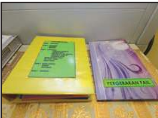
Penyediaan Buku Rekod Pergerakan Fail