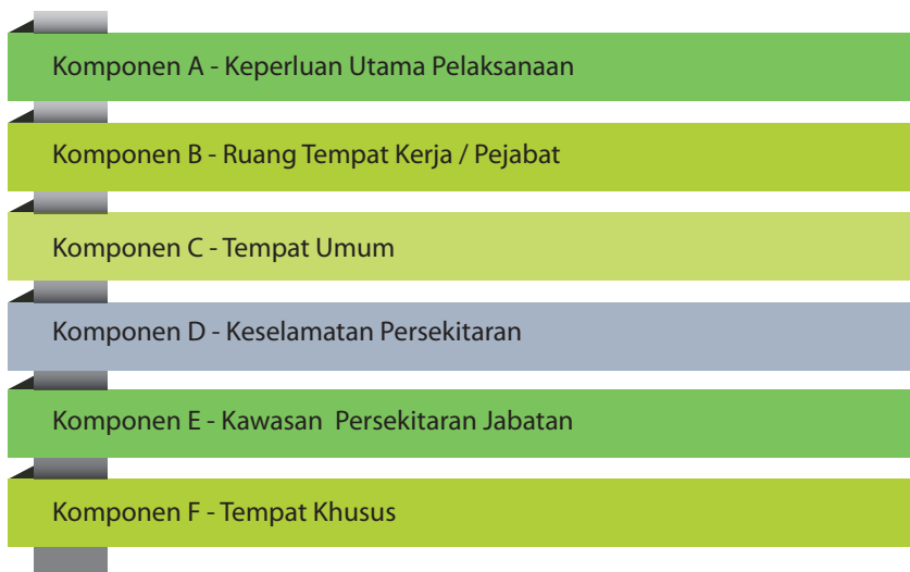
Rajah 4: Komponen-komponen Penilaian

Penilaian Model A adalah berdasarkan kriteria generik manakala penilaian Model B merupakan gabungan antara kriteria generik dan khusus. Kriteria penilaian yang diguna pakai adalah mengikut kesesuaian jabatan/agensi di mana terdapat 6 komponen kriteria penilaian seperti pada Rajah 4 . Kriteria-kriteria yang disusun adalah bersesuaian dengan keperluan yang terdapat di pelbagai jabatan/agensi. Ini bagi memastikan pengauditan dilaksanakan secara menyeluruh dan memenuhi aspek kepelbagaian dan perbezaan antara sesuatu jabatan/agensi. Kategori jabatan/agensi yang dinilai adalah seperti pada Rajah 5 . Panduan lengkap bagi setiap komponen penilaian dan contoh amalan baik adalah seperti pada Lampiran I dan II .