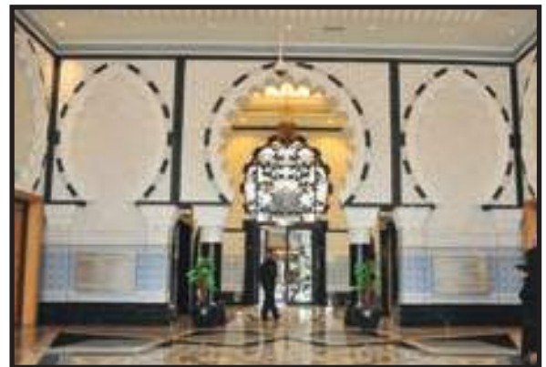
Penampilan Imej Korporat