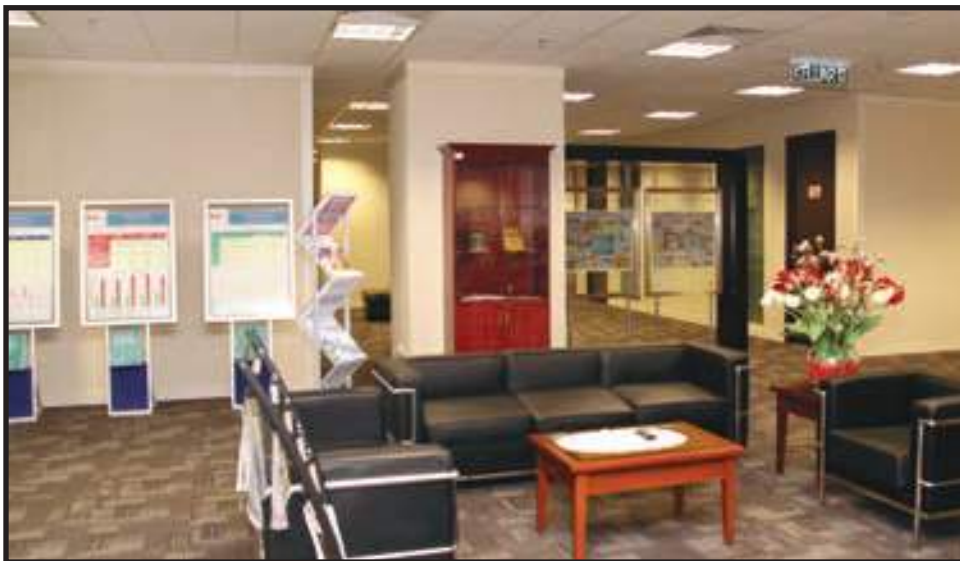
Susun Atur Perabot yang Kemas

Imej Korporat merujuk kepada identiti atau persepsi pelanggan/pihak berkepentingan terhadap persekitaran, tindakan dan pencapaian sesebuah organisasi. Nilai, etika dan norma kerja yang seragam dalam kalangan warga kerja amat diperlukan untuk mewujudkan budaya korporat yang positif. Selain ciri-ciri ini, EKSA juga turut menitikberatkan aspek keselamatan persekitaran di setiap jabatan/agensi sektor awam.