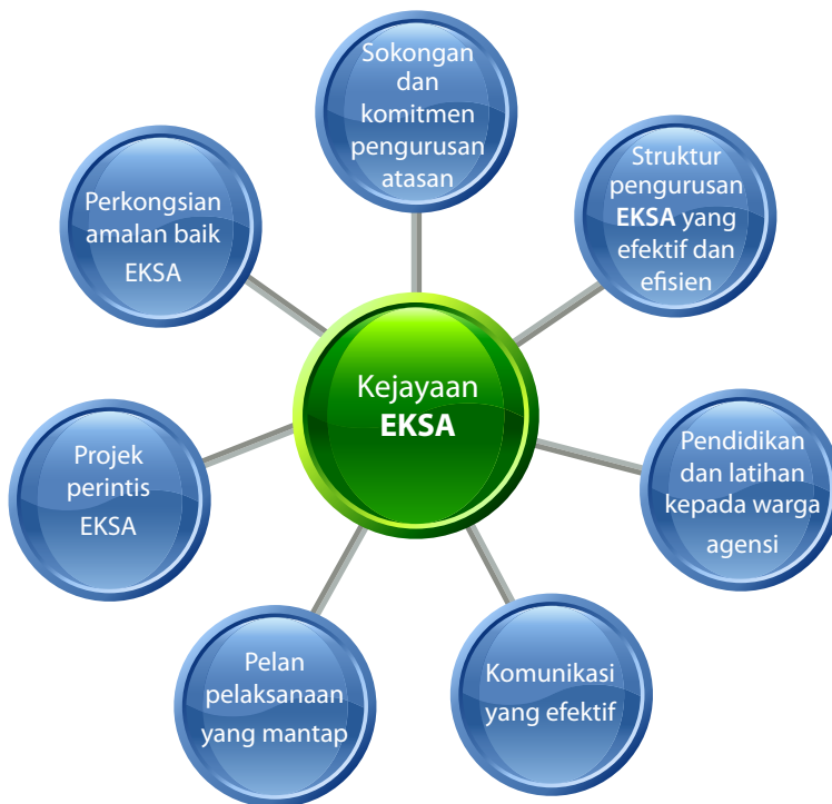
Rajah 9: Kunci Kejayaan EKSA

Kejayaan pelaksanaan EKSA di sesuatu jabatan/agensi bergantung pada faktor-faktor seperti pada Rajah 9 .