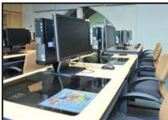
Kemudahan Peralatan Komputer di Bilik Latihan