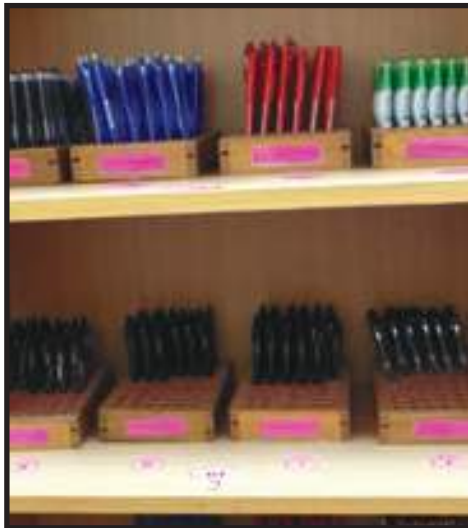
Tempat Simpanan Alat Tulis yang Kreatif

Dalam usaha untuk mempertingkatkan produktiviti di tempat kerja, EKSA menggalakkan warga jabatan/agensi membudayakan elemen kreativiti dan inovasi semasa melaksanakan tugas dan tanggungjawab masing-masing. Persekitaran sektor awam yang sering kali berubah mengikut peredaran masa menuntut pewujudan budaya organisasi yang dinamik berasaskan kreativiti dan inovasi. Warga jabatan/agensi digalakkan untuk sentiasa berfikir di luar kotak ( out of the box ) untuk menghasilkan persekitaran kerja yang kondusif dan selamat.