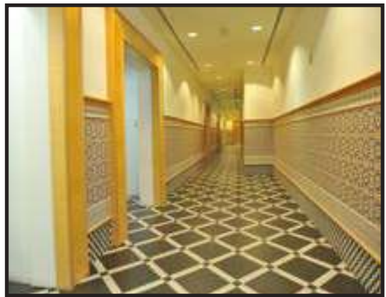
Lantai yang Bersih