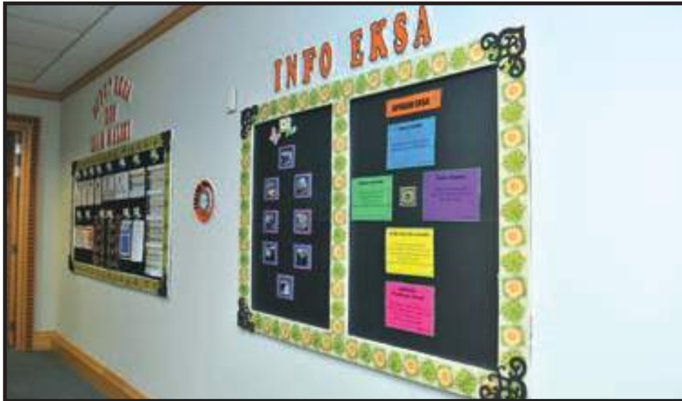
Penyediaan Sudut EKSA