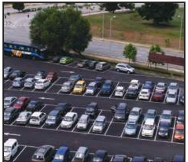
Lot-lot Tempat Letak Kenderaan