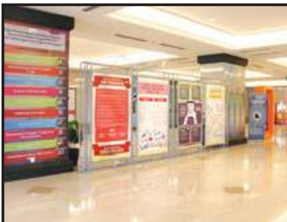
Maklumat Agensi Dipaparkan