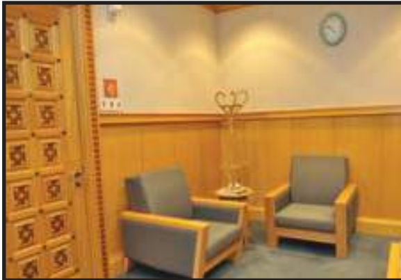
Perhiasan yang Minimum