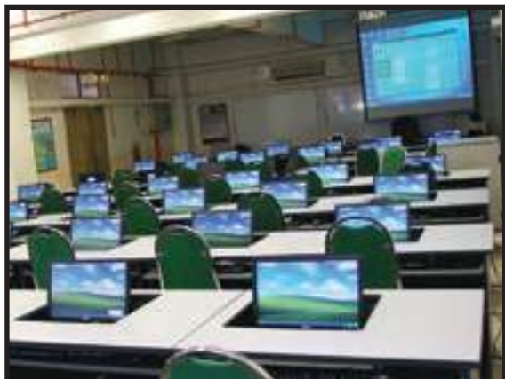
Bilik Komputer yang Kemas dan Tersusun