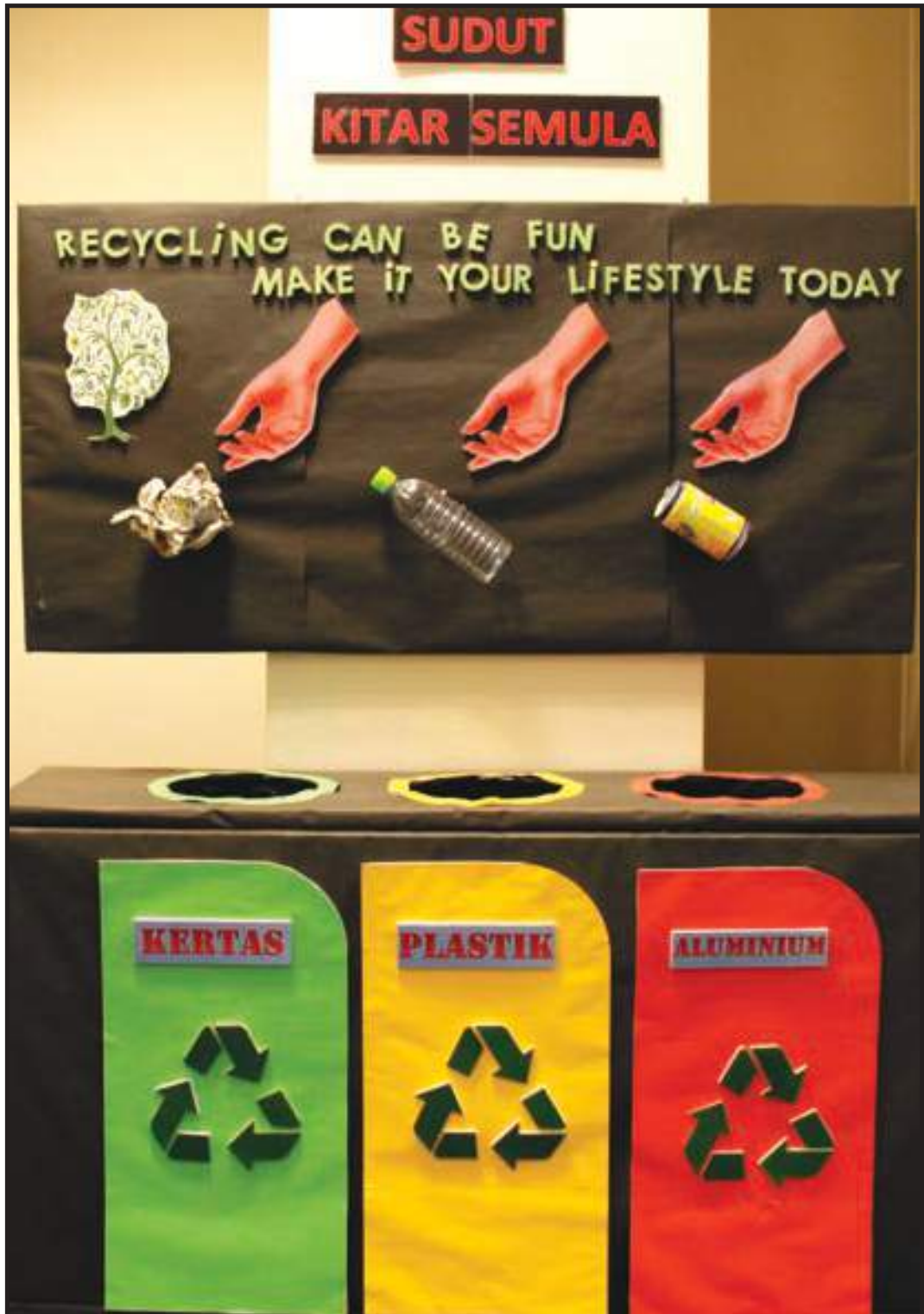
Pembudayaan Amalan Hijau