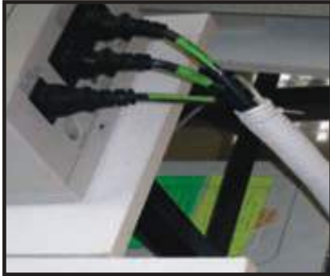
Soket Elektrik Diikat Rapi