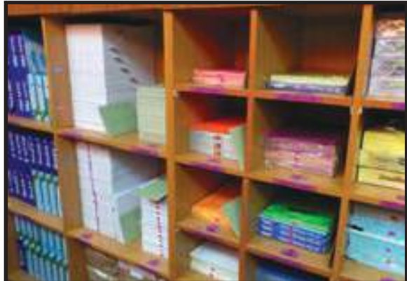
Stor Peralatan Pejabat Teratur