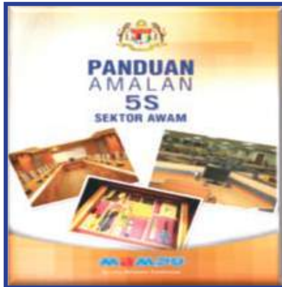
Rajah 1: Buku Panduan Amalan 5S Sektor Awam

MAMPU telah memperkenalkan Amalan 5S Sektor Awam pada tahun 2010 melalui Panduan Amalan 5S Sektor Awam seperti pada Rajah 1 di atas.