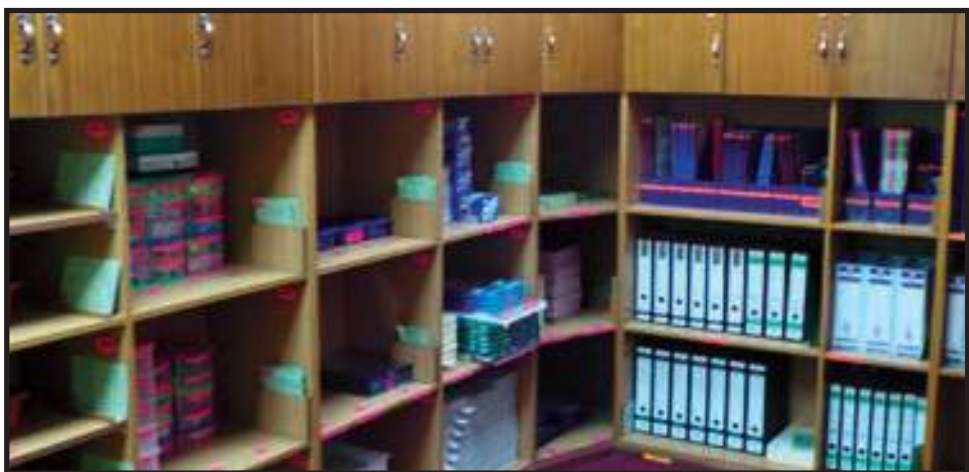
Pelabelan yang Memudahkan Carian

Dalam usaha untuk mempertingkatkan produktiviti di tempat kerja, EKSA menggalakkan warga jabatan/agensi membudayakan elemen kreativiti dan inovasi semasa melaksanakan tugas dan tanggungjawab masing-masing. Persekitaran sektor awam yang sering kali berubah mengikut peredaran masa menuntut pewujudan budaya organisasi yang dinamik berasaskan kreativiti dan inovasi. Warga jabatan/agensi digalakkan untuk sentiasa berfikir di luar kotak ( out of the box ) untuk menghasilkan persekitaran kerja yang kondusif dan selamat.