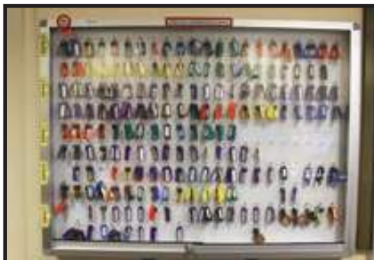
Kawalan Kunci yang Sistematik