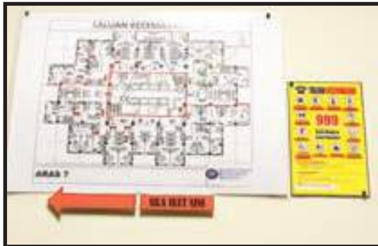
Pelan Tindakan Kecemasan