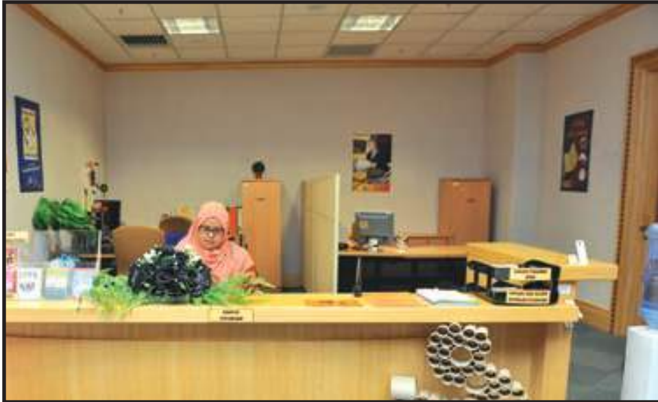
Penampilan Imej Korporat di Kaunter