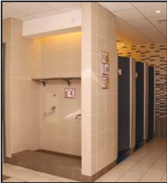
Tandas Bersih dan Kering