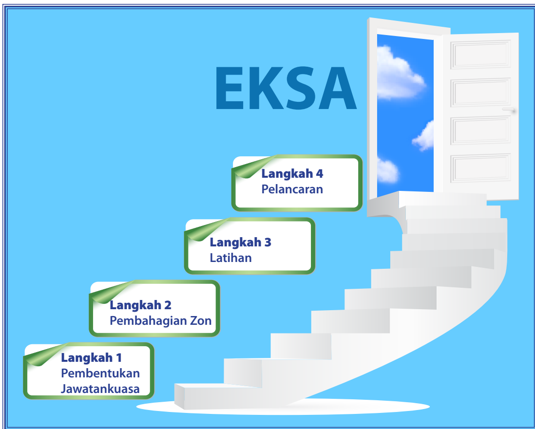
Rajah 2: Langkah Pelaksanaan EKSA