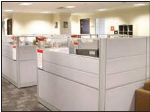
Ruang Kerja Tersusun