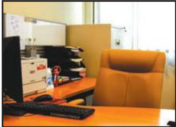
Meja Kemas dan Bersih