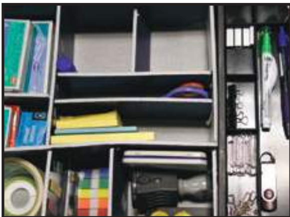
Alat Tulis Disusun Kemas