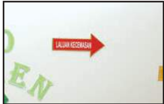
Tanda Laluan Kecemasan yang Jelas