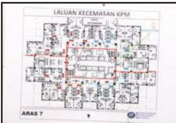
Pelan Lantai yang Menarik