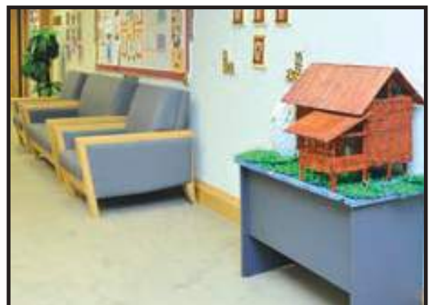
Ruang Pejabat yang Selesa