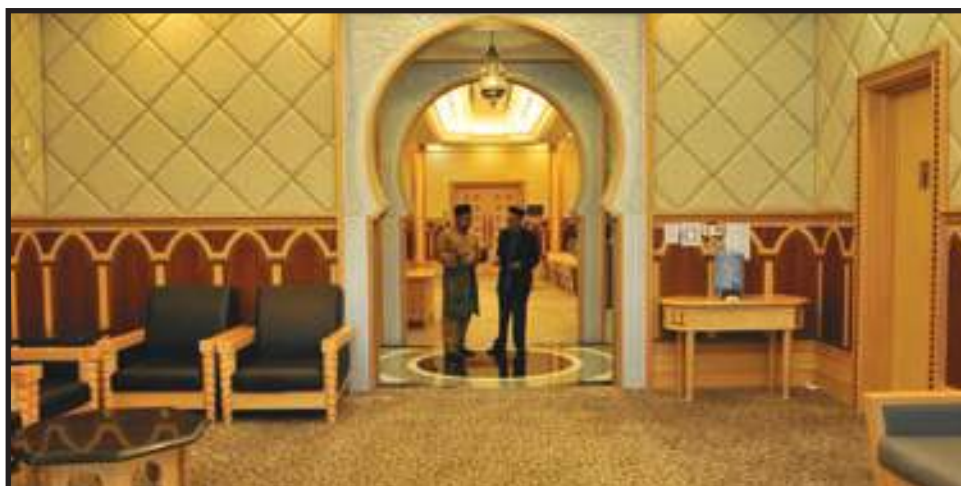
Ruang Umum yang Kondusif