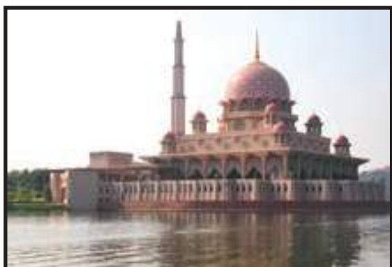
Persekitaran Masjid yang Bersih