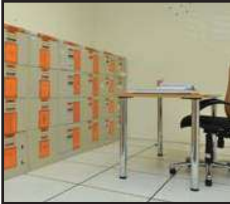
Susun Atur Bilik Fail yang Kemas