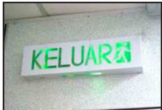
Lampu Tanda Arah Keluar Jelas dan Berfungsi