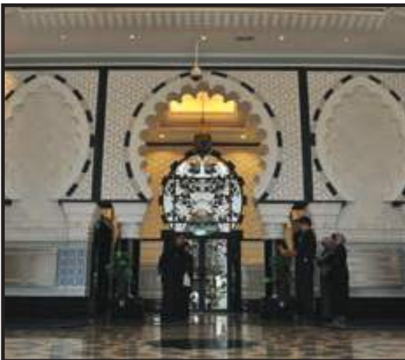
Kawasan Persekitaran dalam Keadaan Baik dan Bersih