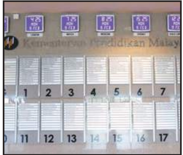
Paparan Maklumat yang Jelas