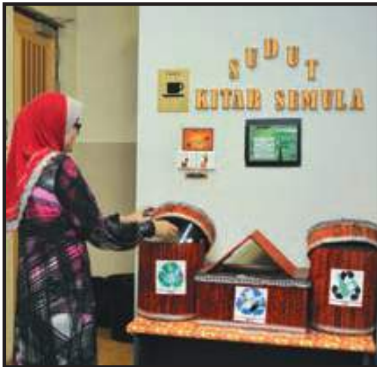
Ruang Kitar Semula

Penekanan turut diberikan pada aspek Amalan Hijau di pejabat dengan melaksanakan program seperti kitar semula dan meningkatkan kecekapan penggunaan tenaga ke arah penjimatan sumber. Aktiviti Amalan Hijau diharap dapat diterapkan kepada keseluruhan warga jabatan/ agensi ke arah penggunaan sumber secara optimum.