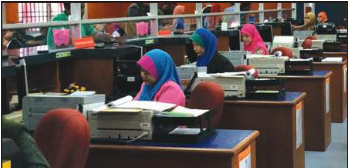
Pengauditan Terhadap Ruang Kaunter