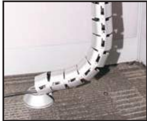
Susunan Wayar dalam Keadaan Baik