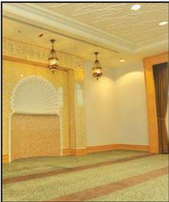
Suasana Surau yang Selesa dan Tenang