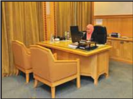
Ruang Kerja Pegawai yang Selesa