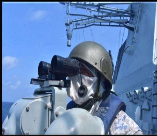
Memperkenalkan Program Recognition of Prior Experience Learning (RPEL)