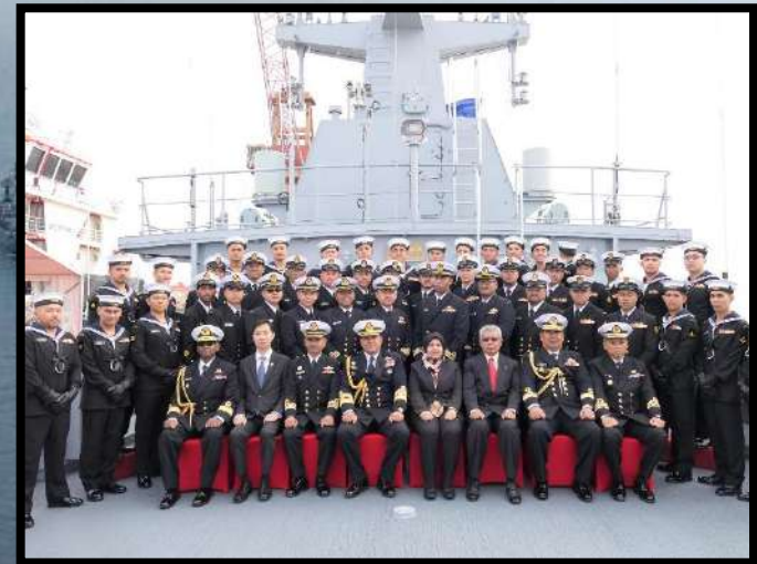
Pentauliahahan KD KERIS pada 6 Jan 2020