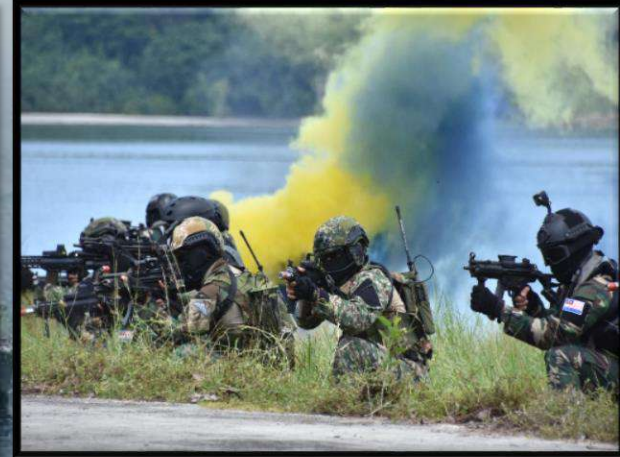
Ekksesais PAHLAWAN pada November 2019