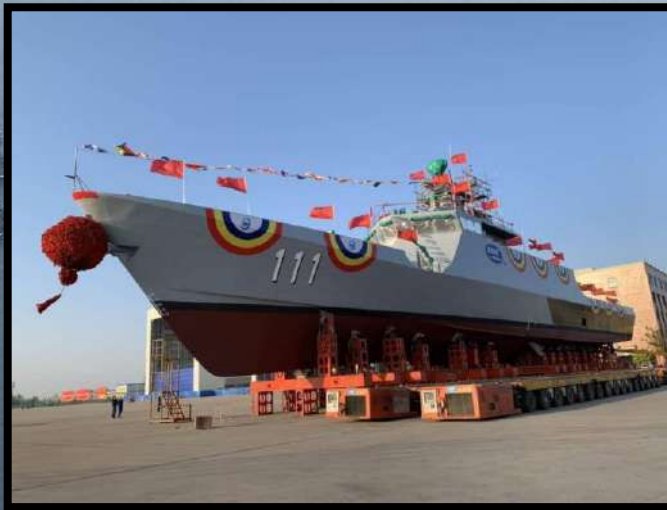
Program pembinaan kapal pertama Kelas LMS

Kajian semula jadual rancangan perolehan dan pelupusan kapal