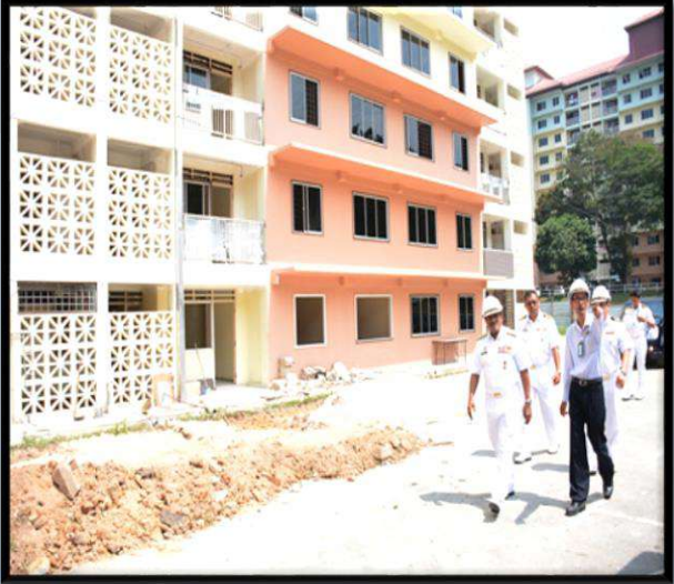
Program Senggaraan RKAT