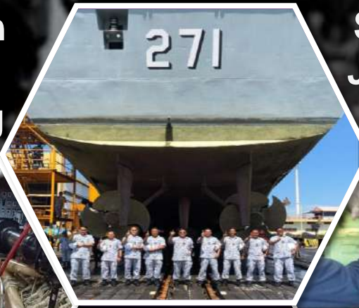
Selenggaraan Jentera Utama Kapal