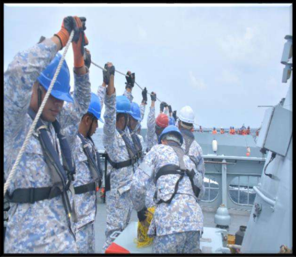
Menambah baik Sistem Latihan Sambil Kerja Kedua (LSK-2)