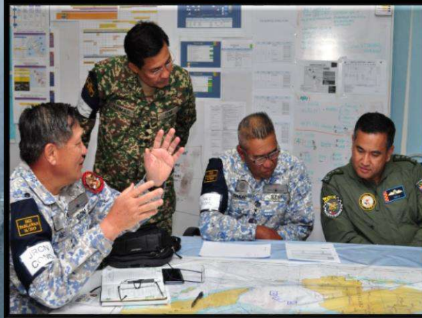
Interoperability & Chain of Command Operasi Bersama