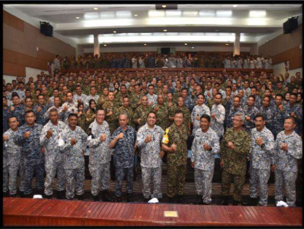
Kerjasama ATM dalam Latihan dan Operasi